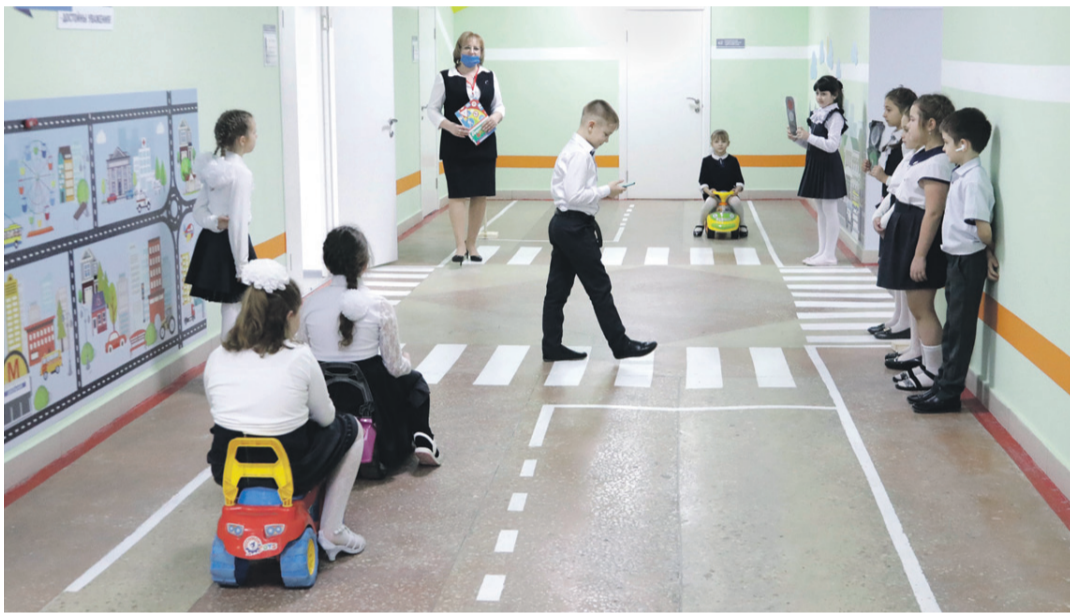
Занятия в образовательной зоне «Правила движения достойны уважения!» в школе № 2

ского творчества. Здесь занимаются и младшие школьники, для которых конструирование роботов — уже привычное дело. Как и для учеников школы с УИОП: в зависимости от возраста детей здесь действует два объединения дополнительного образования — «Робототехника» и «Введение в робототехнику».