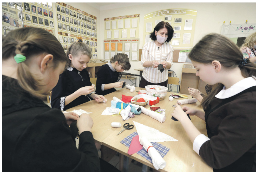
В рамках программы «Народная и авторская кукла» ученицы Новоалександровской школы учатся шить куклу-столбушку