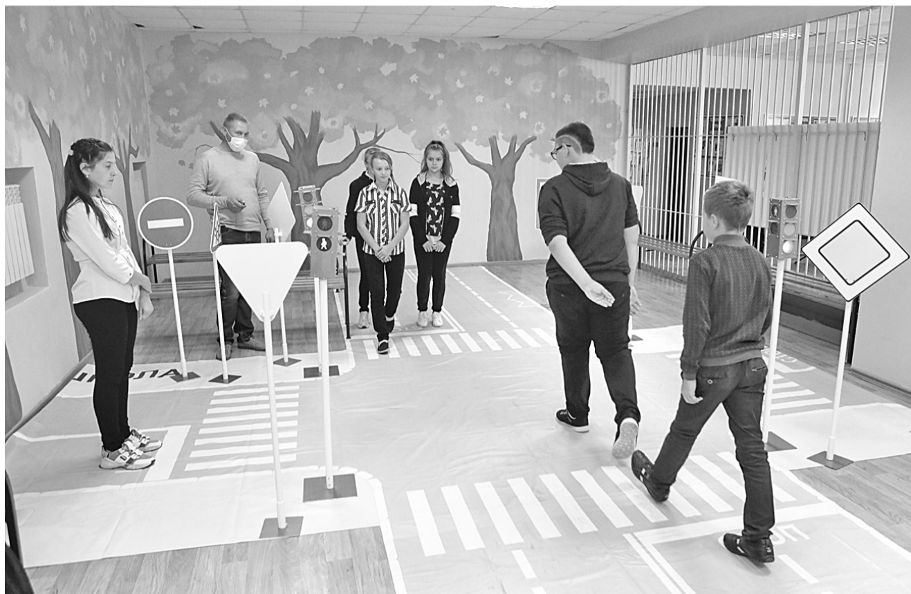
В Курасовской школе Ивнянского района

В наших школах во второй половине дня организованы пятиминутки безопасности перед уходом школьников домой, просмотр видеороликов, выступления агитбригад, проведение интеллектуально-познавательных и сюжетно-ролевых игр, целевых прогулок и экскурсий. Белгородская область принимает участие во всех всероссийских мероприятиях, которые рекомендованы Министерством просвещения Российской Федерации. Мы не можем делать выводы о воспитательном воз-