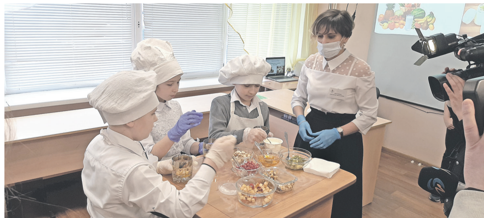
На внеурочке, посвящённой правильному питанию, ученики школы с УИОП готовят вкусные и полезные блюда