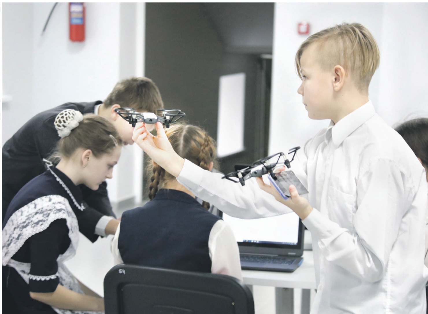
Квадрокоптерами сейчас даже в сельской школе никого не удивишь. С ними легко справляются в «Точке роста» Ровеньской школы № 2

На занятии внеурочной деятельности у младших школьников «Начинаем изучать английский язык» нам показали, как можно использовать флеш-карты (не компьютерные флешки, а карточки