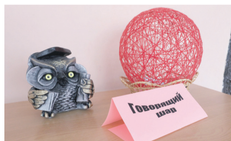
«Говорящий шар» в школе с УИОП. Ученики бросают в него свои отзывы и пожелания