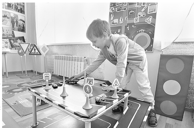
В детском саду «Сказка» пос. Ивня