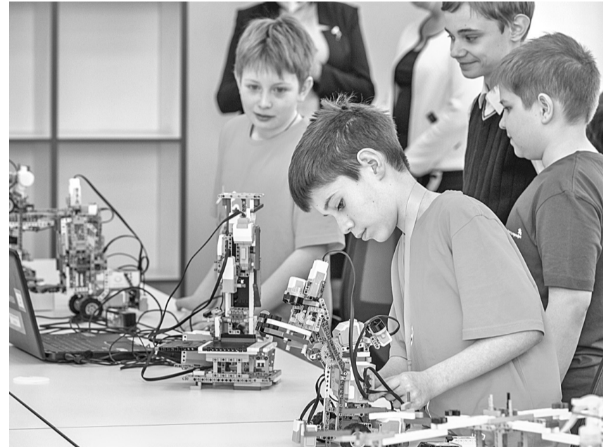
Студия робототехники Шуховского лицея