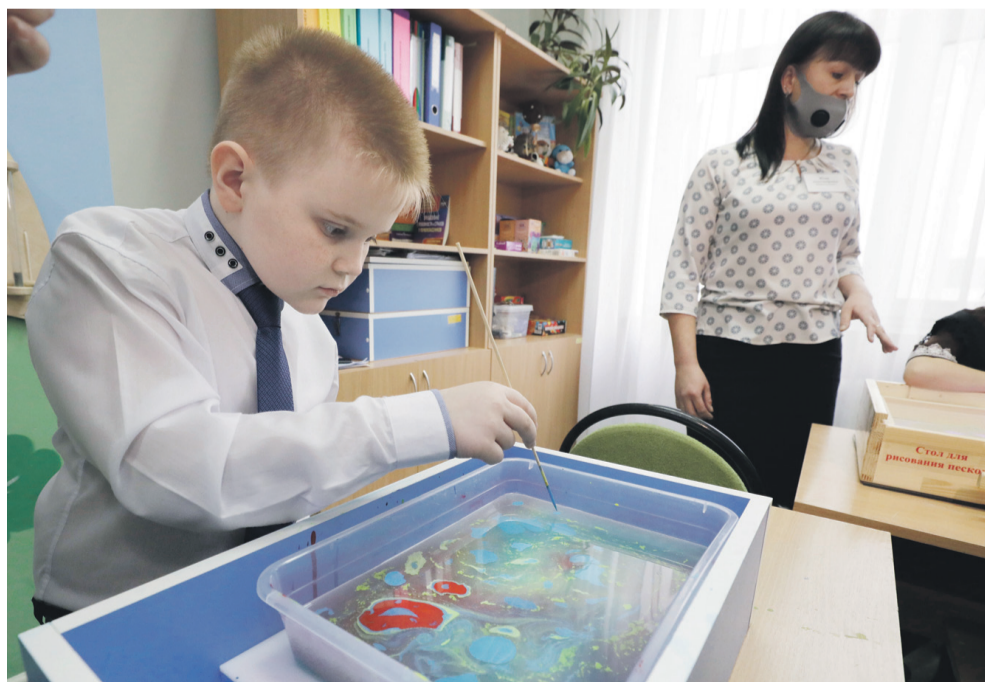
Занятие по акваанимации в Новоалександровской школе

Дальше директор ведёт нас в «деревню Йогуртово». Она расположилась в обычном классе, только вместо учебников и ручек на столе — йогурты, фрукты и другие начинки и добавки.