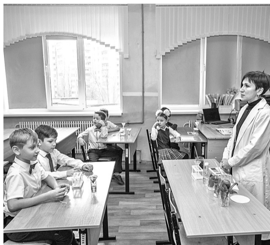
Шуховцы изучают кислотность почв