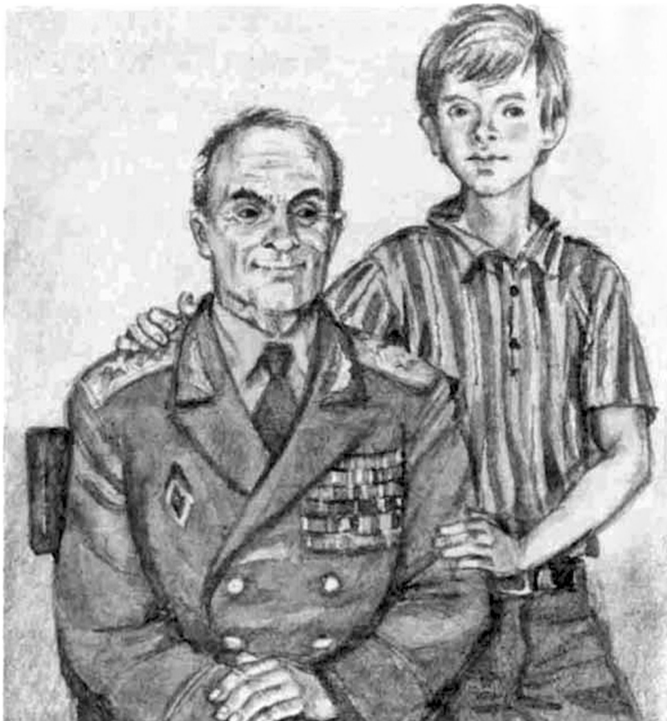
Иллюстрация к повести «Мой генерал» художника Юрия Иванова

ЧИТАТЬ СТАТЬЮ «ИСКАТЬ ДОБРО ВОКРУГ СЕБЯ» О КНИГЕ «НЕЗАБЫТЫЕ ИГРУШКИ»