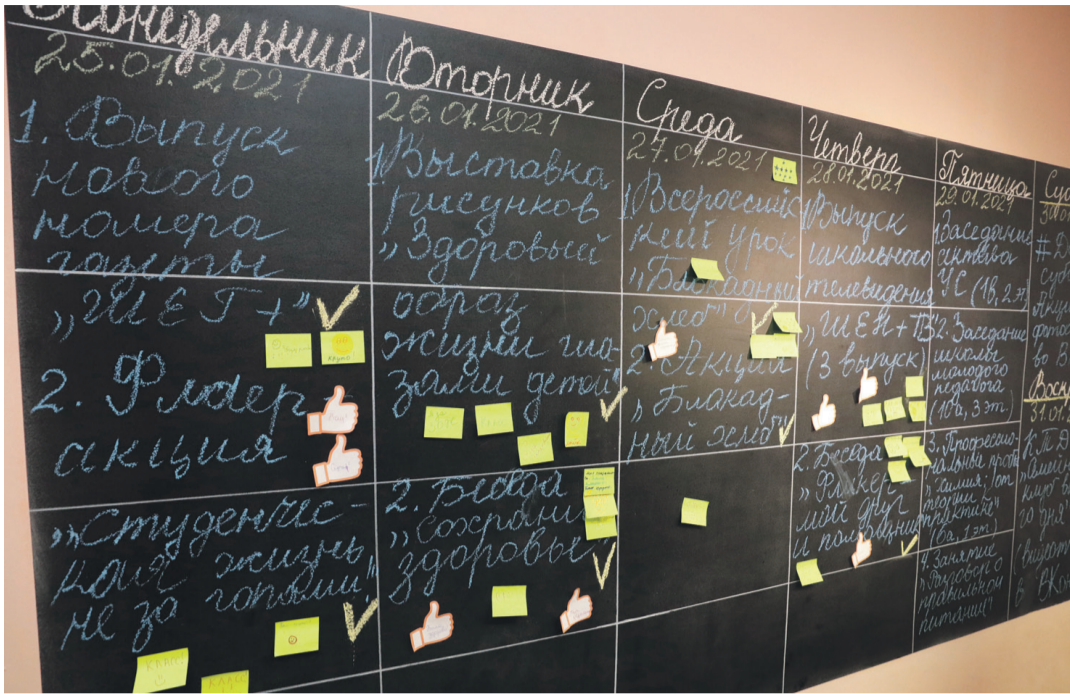
«Говорящая» стена в школе с УИОП