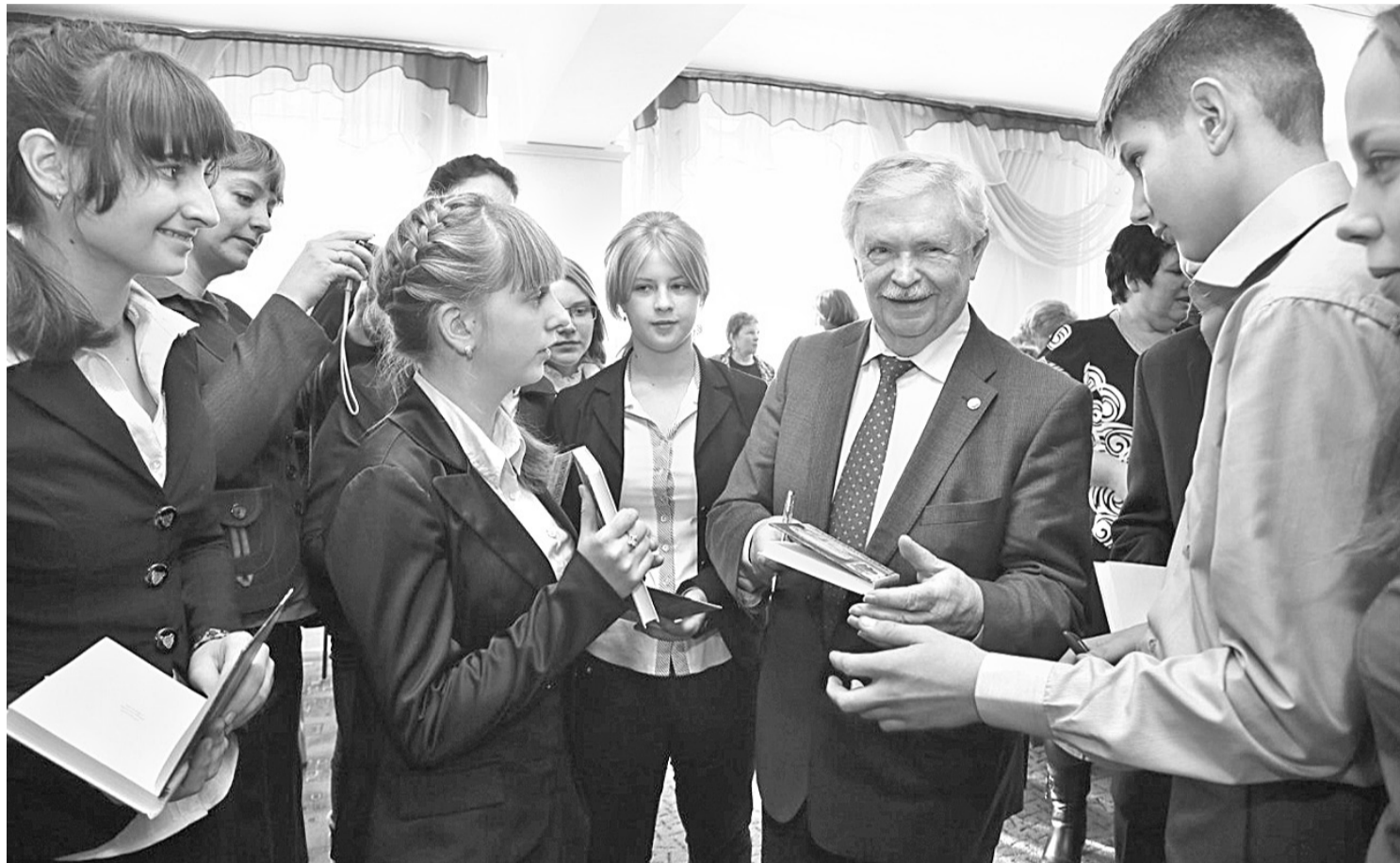
Альберт Лиханов в Грайворонской районной библиотеке

ПОЧЕМУ ЧИТАТЕЛЕЙ ПРОИЗВЕДЕНИЙ АЛЬБЕРТА ЛИХАНОВА МОЖНО НАЗВАТЬ НРАВСТВЕННЫМИ ЛЮДЬМИ