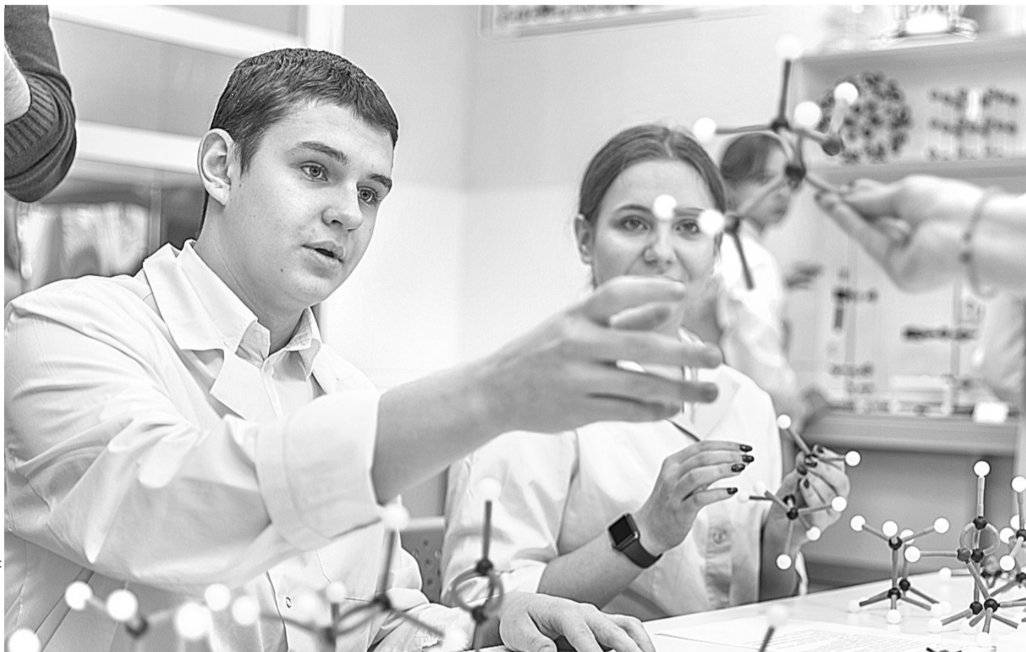
В химической лаборатории Шуховского лицея

В СОЦИАЛЬНЫХ СЕТЯХ ПОЯВЛЯЛОСЬ МНОГО СООБЩЕНИЙ О ТОМ, ЧТО СИТУАЦИЯ С КОРОНАВИРУСОМ — ЭТО ОСНОВАНИЕ ДЛЯ ПЕРЕВОДА ВСЕЙ СИСТЕМЫ ОБРАЗОВАНИЯ В ДИСТАНЦИОННЫЙ ФОРМАТ НА ПОСТОЯННОЙ ОСНОВЕ. УБЕЖДАТЬ НАРОД, ЧТО ТАКИЕ ЗАЯВЛЕНИЯ ОДНОЗНАЧНО БЕСПОЧВЕННЫ, НАМ СУЩЕСТВЕННО ПОМОГАЛ ОПЫТ ШКОЛ РАН, КОТОРЫЕ ПРОДЕМОНСТРИРОВАЛИ, ЧТО ОБРАЗОВАНИЕ — НЕ ТОЛЬКО ПРИОБРЕТЕНИЕ СУММЫ ЗНАНИЙ, НО ЭТО, ПРЕЖДЕ ВСЕГО, СОЦИАЛИЗАЦИЯ РЕБЯТ, ПЕРЕДАЧА ОПЫТА ПОКОЛЕНИЙ, ДУХОВНО-НРАВСТВЕННЫХ ЦЕННОСТЕЙ, ЧТО ЯВЛЯЕТСЯ НЕВОЗМОЖНЫМ БЕЗ ЛИЧНОСТИ УЧИТЕЛЯ, БЕЗ НЕПОСРЕДСТВЕННОГО ВЗАИМОДЕЙСТВИЯ С УЧИТЕЛЕМ, БЕЗ УЧАСТИЯ РЕБЁНКА В КОЛ-