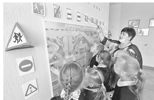
В Клименковской школе Вейделевского района

действию этих мероприятий на конкретного ребёнка сиюминутно, потому что результат, как правило, отдалён во времени, к тому же отсутствуют измерители воспитанности и сформированности навыка поведения на дороге. Но ни одна школа не стоит в стороне от этой работы.