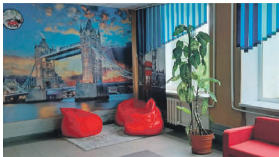
Рекреационная зона в школе № 1