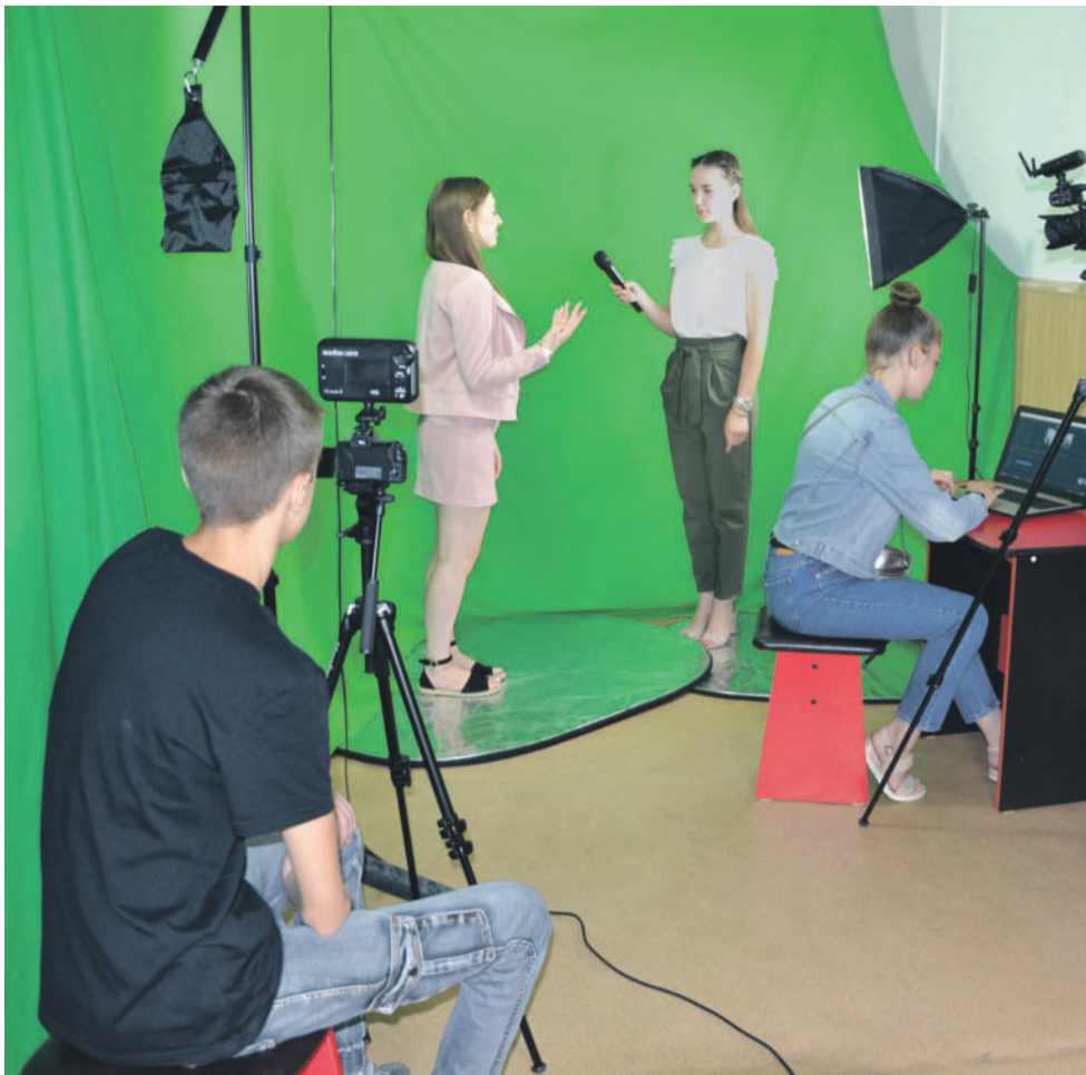
В школьном медиацентре «МедиаДикт» школы № 1