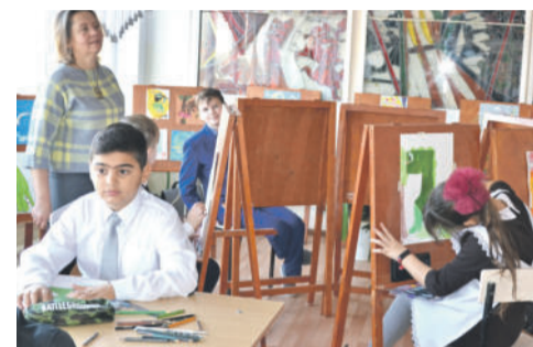
В изостудии школы № 4