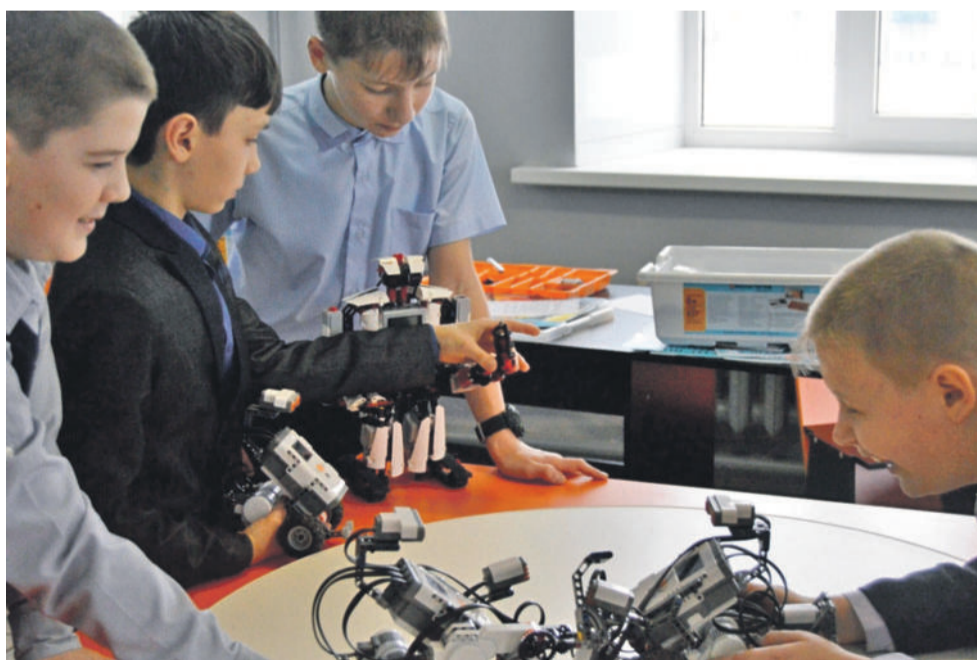
Технопарк в школе № 1

Ещё один важнейший элемент современной инфраструктуры — создание цифровой образовательной среды. Для решения проблемы взаимоотношений «цифровые ученики и нецифровые» учителя создали школьный медиаклуб «МедиаДикт».