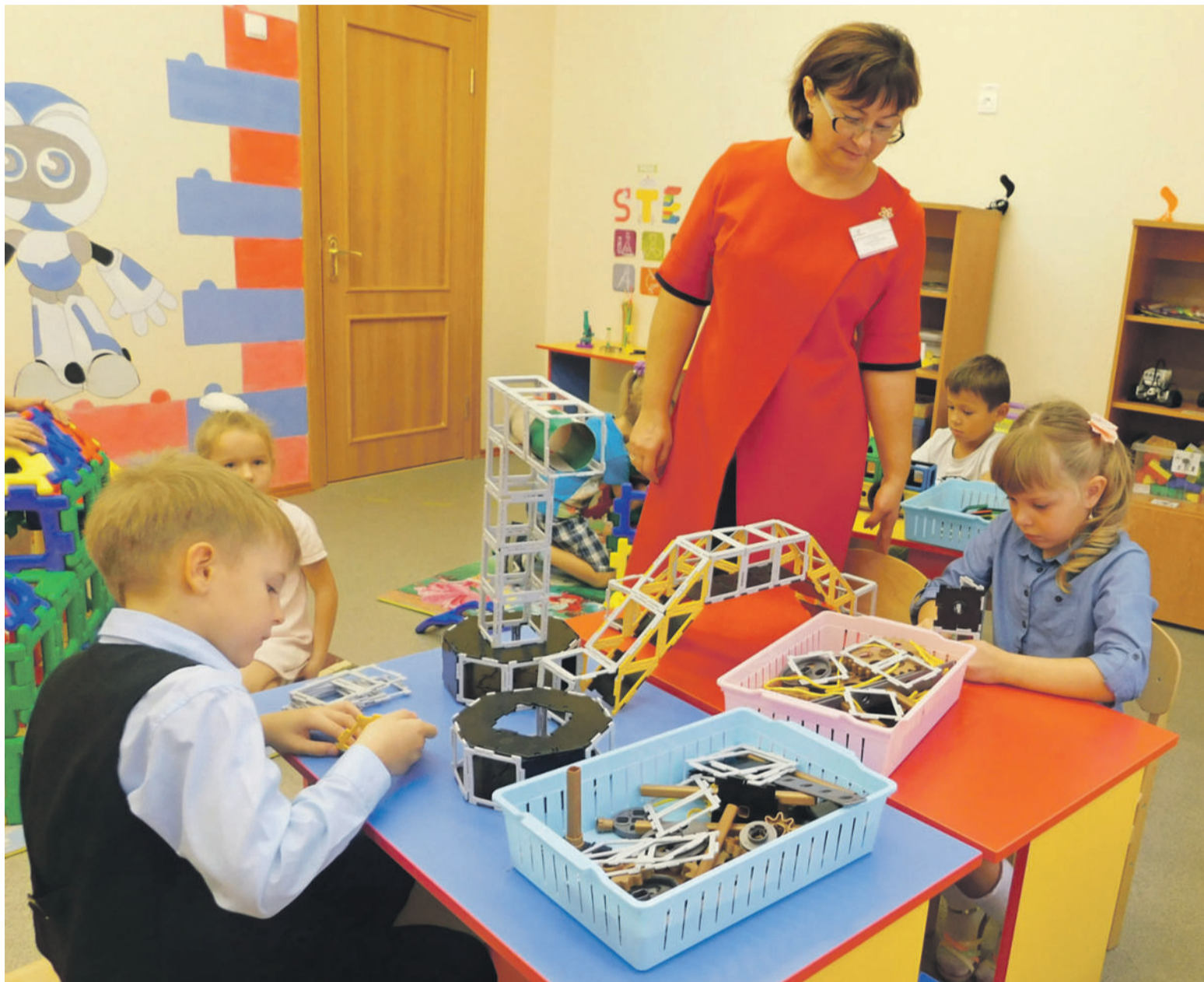
Инженерное образование малышей начинается с конструирования

Школьный технопарк позволяет создать эффективную систему профориентации, популяризировать среди школьников и их родителей востребованные инженерные и технические специальности. И, конечно, помогает выявить «техно-звёздочки» среди учеников в сетевом взаимодействии образовательных учреждений города.