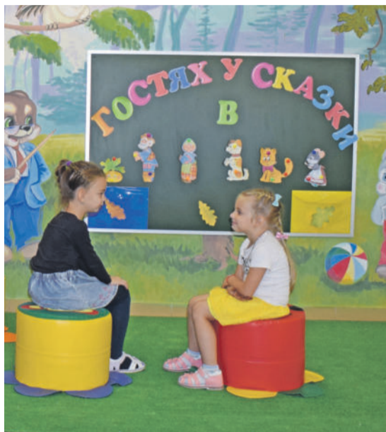
В детском саду № 4