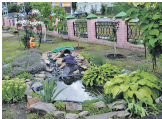
Ландшафтный дизайн на территории школы № 2