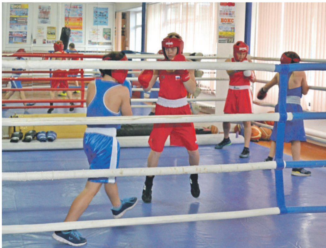
Тренировки по боксу в школе № 4