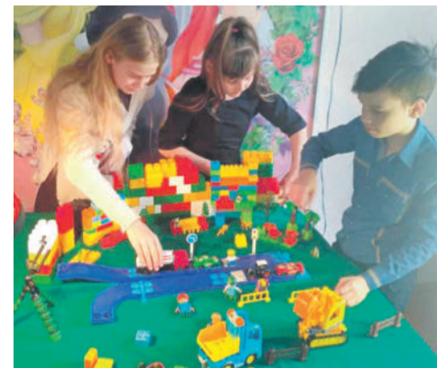
Студия мультипликации в Доме детского творчества