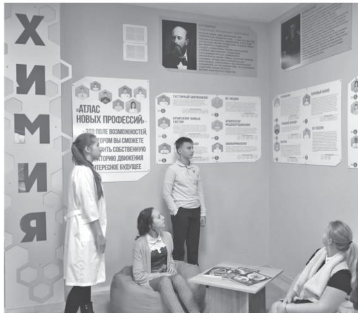
Профориентационная зона в школе № 1