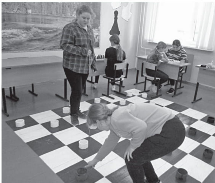
Игровая зона в Глинской школе