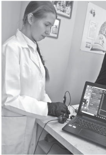
В школе № 1