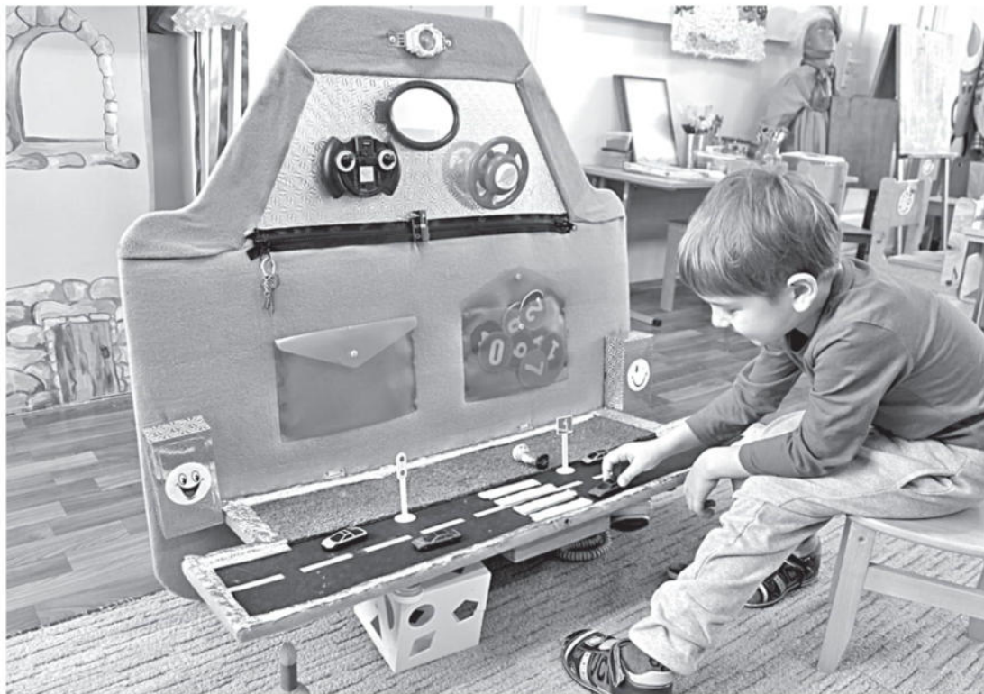
Игровая зона в детском саду № 8

СЕГОДНЯ СВОИМ ОПЫТОМ ДЕЛЯТСЯ УЧРЕЖДЕНИЯ ОБРАЗОВАНИЯ НОВООСКОЛЬСКОГО ГОРОДСКОГО ОКРУГА