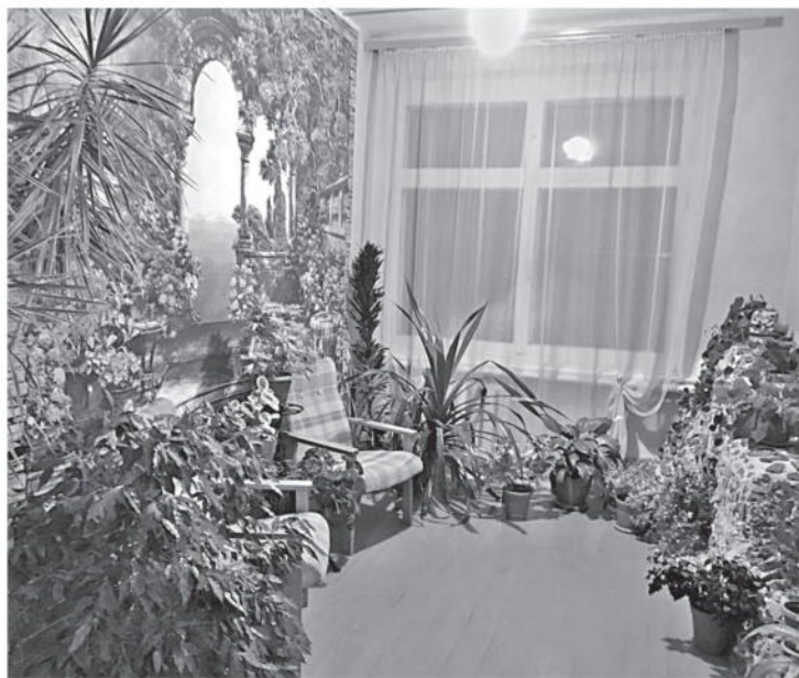
Зимний сад в Васильдольской школе