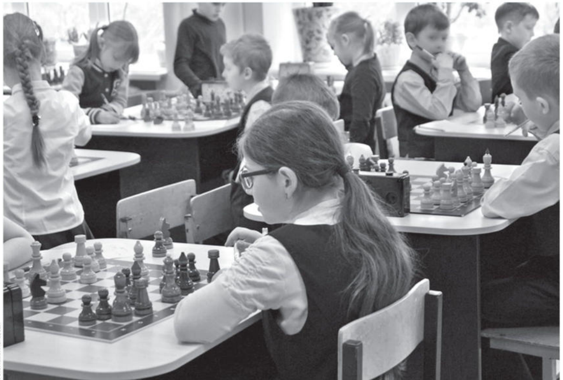
В образовательном комплексе «Луч»

— Высокий уровень локального нормотворчества. В этих учебных заведениях есть хорошо проработанные локальные нормативные акты, которые обеспечивают порядок. Основные образовательные программы и программы развития направлены на активное познание мира, развитие учебно-исследова-