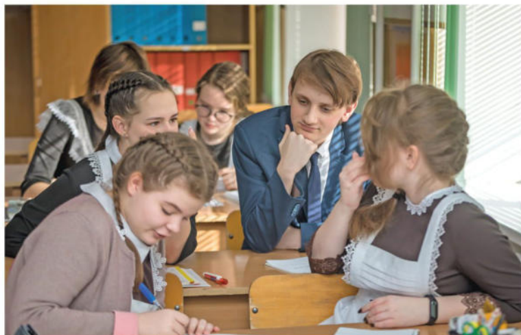
Урок обществознания в 10-м «Б» классе

Ольга МУШТАЕВА » ТЕКСТ.