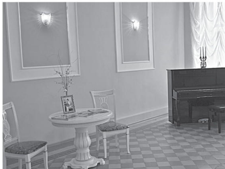
Ольгинский зал школы № 1