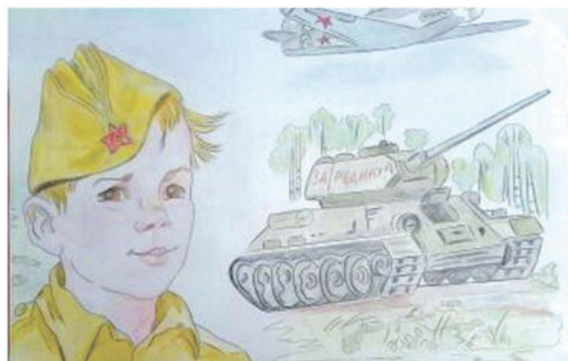
Рисунок Дарьи Лопиной (Корочанская школа им. Д. Кромского)