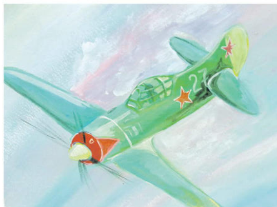
Воздушный бой. Рисунок Дмитрия Новикова (Корочанская школа им. Д. Кромского)