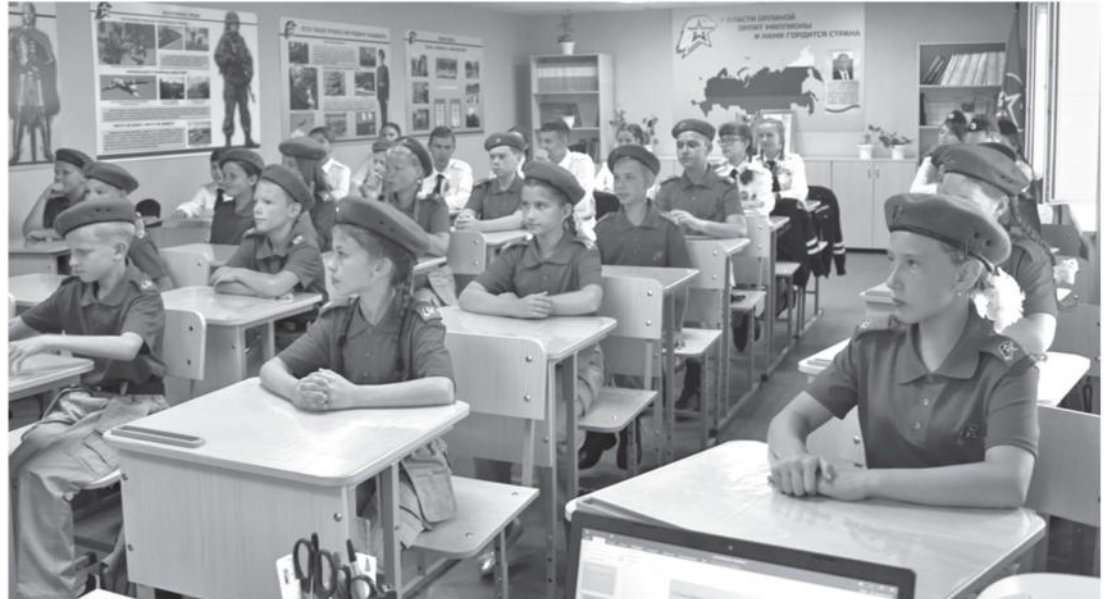
Кадетский класс школы № 1

КОЛЛЕГИ! МЫ ПРИГЛАШАЕМ ВАС СТАТЬ НЕ ТОЛЬКО ЧИТАТЕЛЯМИ, НО И АВТОРАМИ ГАЗЕТЫ!