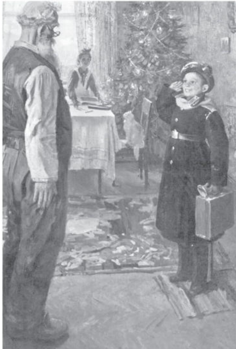
Прибыл на каникулы. Картина Фёдора Решетникова. 1948 г. Государственная Третьяковская галерея, г. Москва (первая часть трилогии)

Но есть и другая группа учеников — и их, к сожалению, большинство, — которых двойка мотивирует не на получение новых знаний, а на то, как в следующий раз с наименьшими потерями обойти возникшие трудности. И тут на первый план выходят те самые многочисленные ГДЗ, которые оказывают ещё более разрушительное воз-