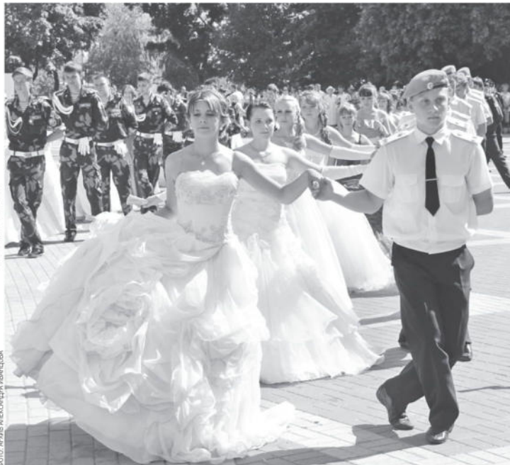
Кадетский бал в Белгороде

Конечно, кадеты-первоклашки — это явление редкое. В основном именно по кадетской программе ребята занимаются с пятого класса. Лишь в трёх школах Белгорода первоклашки уже с первых дней учёбы приобщаются к военной науке: в 19-й, 21-й и 41-й. Есть в Белгороде и полностью кадетская школа — 45-я. В остальных школах в каждой параллели есть хоть один обычный, некадетский класс: не все ребята хотят углублённо изучать военную подготовку. В 45-й школе, кстати, тоже не всех заставляют шагать строем и участвовать в кадетских мероприятиях. Если у ребёнка и родителей нет жела-