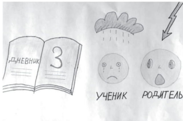
Рисунки учеников школы № 3 г. Строителя