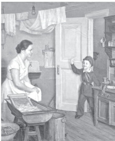
Опять пятёрка! Картина Николая Заболотского. 1954 г.