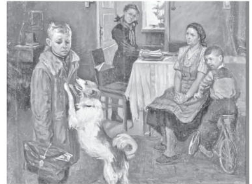
Опять двойка. Картина Фёдора Решетникова. 1952 г. Государственная Третьяковская галерея, г. Москва (вторая часть трилогии)

Двойка часто воспринимается учениками как личная обида, как жуткая несправедливость по отношению к себе. Школьник может принять отметку не как оценку его знаний в конкретный момент, а как оценку его личности, как проявление неприязни со стороны учителя. И тут может назреть конфликт.