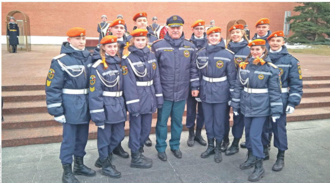
2019 год. Победители XVI Всероссийского кадетского сбора в Москве

1979 год. Хмельницкое окончено. Куда же направят служить? Волей судьбы вновь оказался