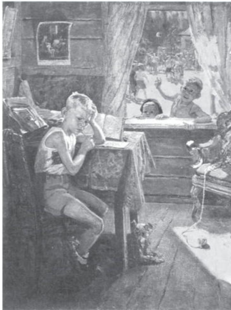
Переэкзаменовка. Картина Фёдора Решетникова. 1954 г. Горловский художественный музей, Донецкая область (третья часть трилогии)

действие на учебную мотивацию школьника и окончательно расхолаживает его.