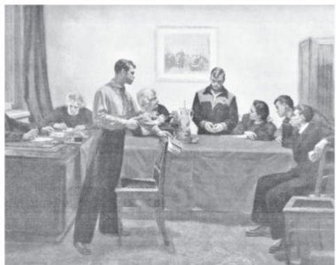
Обсуждение двойки. Картина Сергея Григорьева. 1953 г. Государственная Третьяковская галерея, г. Москва

Ещё одна картина — «Обсуждение двойки» Сергея Григорьева — изображает заседание комсомольского комитета советской школы, где разбирается дело старшеклассника, получившего двойку. Мы понимаем, что двойка этого ученика перестала быть его личным делом и делом его семьи, а стала предметом внимания всего школьного коллектива. Тот самый двоечник, по всей видимости, спортсмен, стоит смущённо перед суровым обвинителем из комсомольского актива. Рядом сидит пожилая учительница и смотрит на него добрыми глазами. Может, это она и поставила ему ту самую злосчастную двойку, а теперь переживает не меньше, чем сам виновник этого заседания. Конечно, в наше время уже тяжело представить себе, что полученную кем-то двойку обсуждают на совете старшеклассников или другом органе ученического самоуправления.