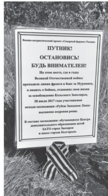
Белгородские школьники посадили аллею в Завоёрске

А сколько ребят мечтают попасть в программу по обмену в город Завоёрск Мурманской области! Четыре года назад между Белгородом и Завоёрском подписано соглашение о сотрудничестве. В том числе и в деле патриотического воспитания. Ведь этот северный город — база атомных подводок Северного флота! С 2017 года ребята из Мурманской области каждый год отдыхают на Белгородской земле, а белгородские школьники едут в военный городок, живут в палатках на берегу реки, знакомятся с настоящими моряками, посещают подводные лодки! Попасть в делегацию по обмену трудно, здесь строгий конкурсный отбор: нужно предоставить портфолио и доказать, что у тебя есть достижения в спортивно-туристской деятельности, лидерские качества. Ну и согласие родителей обязательно.