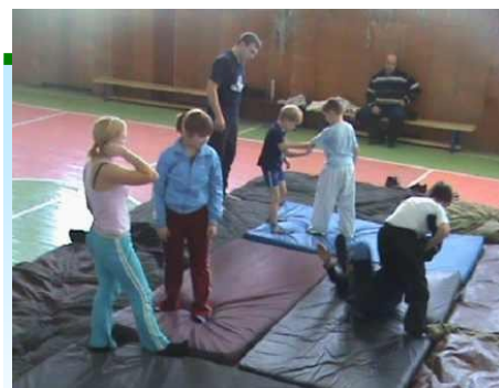
Мастер-класс проводит Мастер спорта международного класса. Чемпион Европы, серебряный призер Кубка Европы