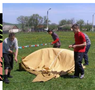
Мы выбрали здоровый образ жизни! А вы?

Приоритетными направлениями в развитии дополнительного образования стали развитие спортивных способностей обучающихся. Функционируют спортивные секции, начал работу военно-спортивный патриотический морской клуб «Дельфин». Обучающиеся включены в разнообразную, соответствующую их возрастным и индивидуальным особенностям, деятельность.