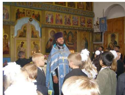
Чистота души – залог здорового образа жизни

Работа с родителями по пропаганде здорового образа жизни среди родителей и вовлечение родителей в процесс решения поставленных задач.