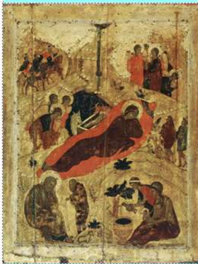
«Рождество Христово», икона Андрея Рублёва

Различные христианские религиозные конфессии отмечают христианское Рождество в середине зимы с 25 декабря (у католиков) по 7 января (у православных). Рождество - праздник, который многое значит для людей, он не проходит бесследно ни для одного человека, который хотя бы раз слышал о жизни Иисуса Христа и о его жертве для людей.