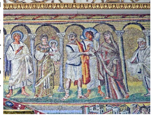
Сретение. Мозаика церкви Санта-Мария Маджоре в Риме. V век

Самое старое и при этом исторически достоверное свидетельство о праздновании Сретения на христианском Востоке — это «Паломничество ко Святым местам». Его написала паломница Этерии (Сильвия) в конце IV века. Она пишет: «В этот день бывает процессия в Анастасис, и все шествуют, и все совершается по порядку с величайшим торжеством, как бы в Пасху. Проповедуют все пресвитеры, и потом епископ... После этого, отправив все по обычному порядку, совершают Литургию». Праздник стал общегосударственным для Византии в VI веке. Вслед за этим традиция торжественного празднования Сретения распространилась по всему христианскому миру.