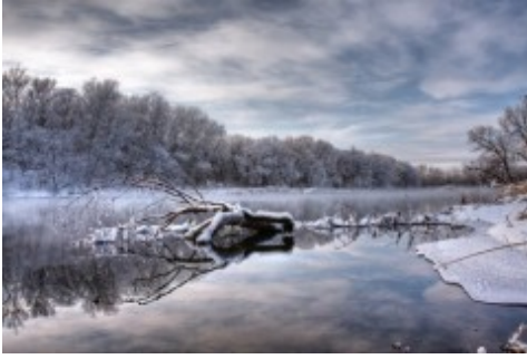
Дуют ветры в феврале...

Народные названия февраля — «бокогрей», «сечень», «снежень», «лютень». Солнце в феврале уже светит на три часа больше, чем в январе. Но холода еще дают о себе знать, частые метели и вьюги. Самый веселый праздник в феврале — Масленица. Он зародился на Руси еще во времена язычества.