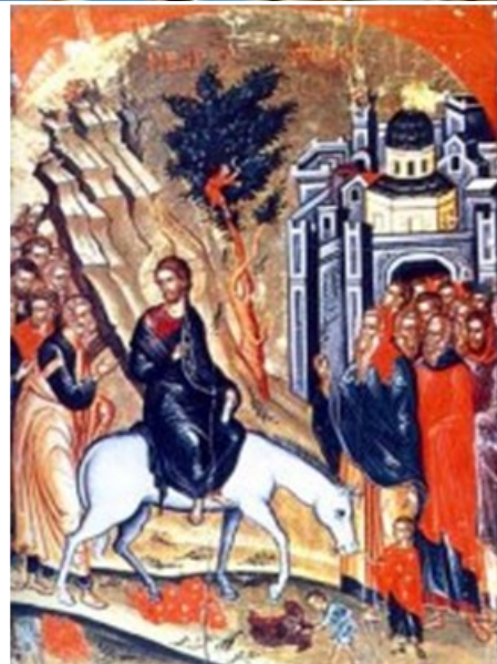
Вход Господень в Иерусалим

криками, с пальмовыми ветвями в руках встречал их. Исполняя пророчества Ветхого Завета (Зах. 9,9), Христос именно таким торжественным образом въезжал в Иерусалим, но не как Царь земной или победитель в войне, а как Царь, Царство Которого не от мира сего, как Победитель греха и смерти. Это царское прославление Христа перед Его смертью Церковь вспоминает для показания, что страдания Спасителя были вольными. На Руси этот праздник давно называется Вербным воскресением. Название происходит от того, что на этот праздник верующие приходят с ветками, как правило, ивовых растений — вербы, ивы, ветлы или других деревьев, которые первыми распускаются весной, в ознаменование тех ветвей, которые резали иудеи, встречавшие Иисуса в Иерусалиме.