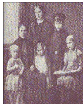
А.П. Гайдар с матерью и сестрами

«Что такое счастье – это каждый понимал по-своему. Но все вместе люди знали и понимали, что надо честно жить, много трудиться и крепко любить и беречь эту огромную счастливую землю, которая зовется Советской страной». А.Гайдар «Чук и Гек»