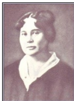
Мать А.П. Гайдара