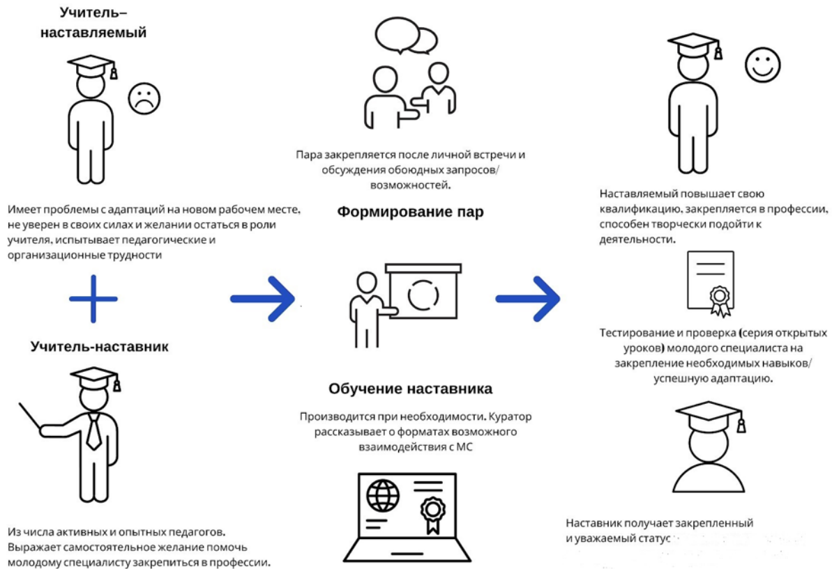
Рисунок 2. Графическое представление взаимодействия по форме «учитель – учитель»