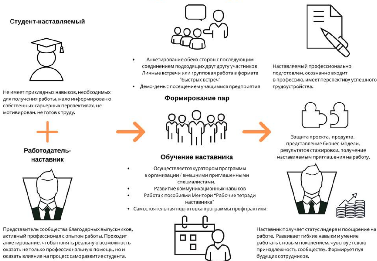
Рисунок 5. Графическое представление наставнического взаимодействия по форме «работодатель – студент»