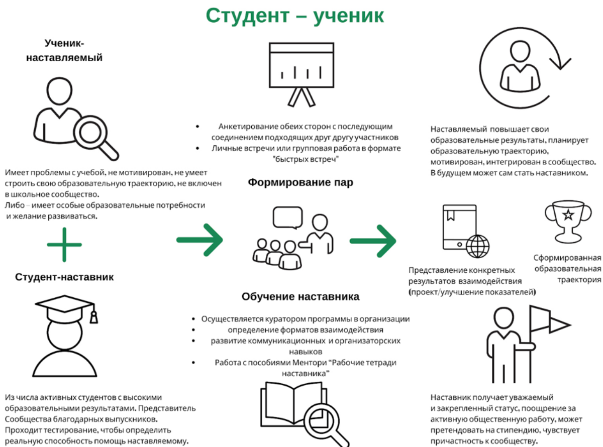
Рисунок 3. Графическое представление наставнического взаимодействия по форме «студент – ученик»