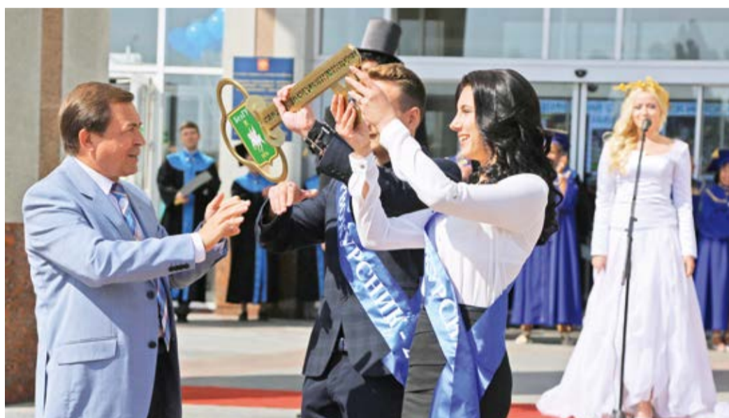
Вручение символического ключа знаний 1 сентября