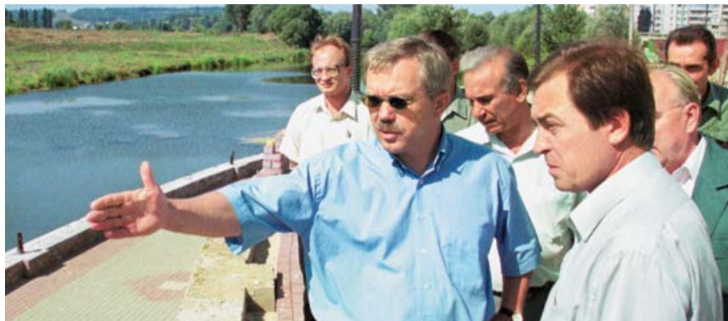
Е.С. Савченко, Глава администрации Белгородской области, Председатель правления Фонда содействия развитию БГУ и О.Н. Полухин, заместитель Главы администрации области, исполнительный директор Фонда содействия развитию БГУ на строительстве нового кампуса БГУ, 1999 г.