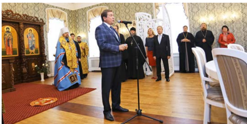
Открытие часовни святой преподобномученицы Евгении Римской на социально-теологическом факультете НИУ «БелГУ», 2016 год