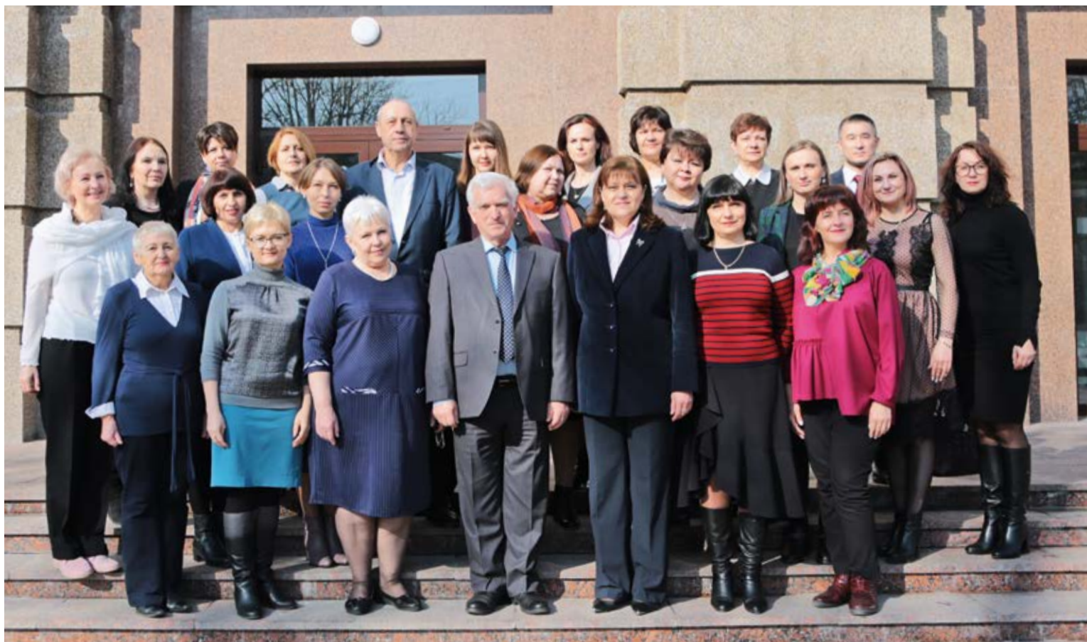
Коллектив кафедры педагогики с выпускниками-аспирантами