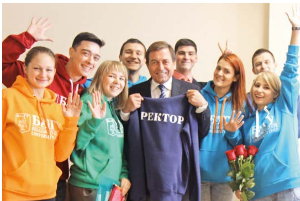
Ректор НИУ «БелГУ» со студенческим активом